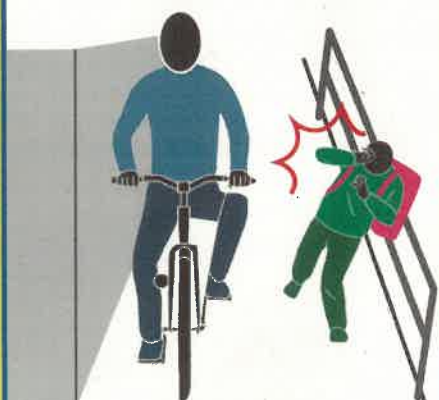
歩道通行時の通行方法違反