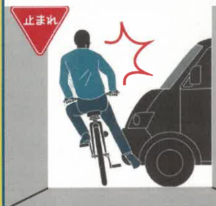
指定場所一時不停止等